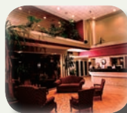
Lord Berri 3