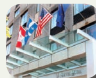
Nouvel hotel & Spa 4