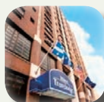
Travelodge Montréal 3*