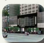
Holiday Inn Midtown 4*